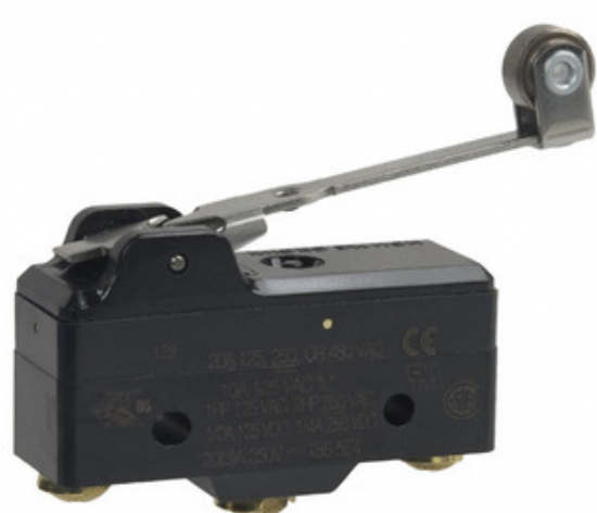
Imagem pode ser representação. Veja as especificações para detalhes do produto.